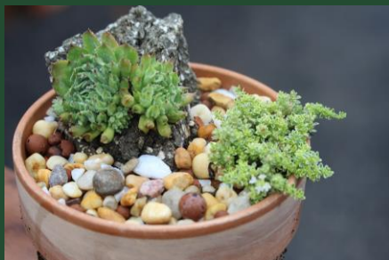
Ensemble Sempervivum 'Oddity' sur un hypertufa et Thymus praecox 'Highland Cream' dans un pot de grès de 15 cm - Majella Larochelle.