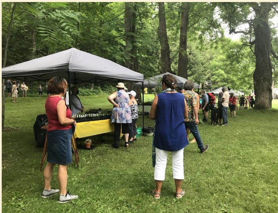
Nous formions un véritable petit village sous les noyers noirs du Domaine Joly-De Lotbinière.