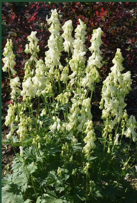
Aconitum barbatum – Rock